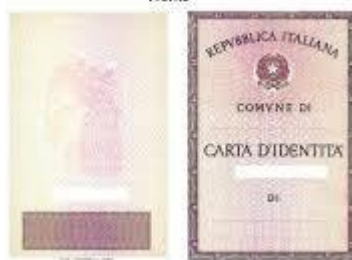
figura 4 Fronte